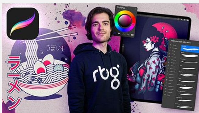
Ilustración digital con Procreate [7 bloques | 18 episodios | 1h 40 min]

Descubre el mundo de la ilustración digital en iPad con Procreate, una herramienta esencial para artistas y diseñadores contemporáneos.